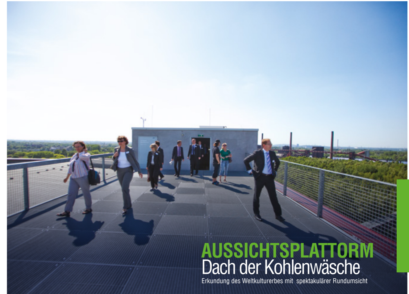
AUSSICHTSPLATTFORM Dach der Kohlenwäsche Erkundung des Weltkulturerbes mit spektakulärer Rundumsicht